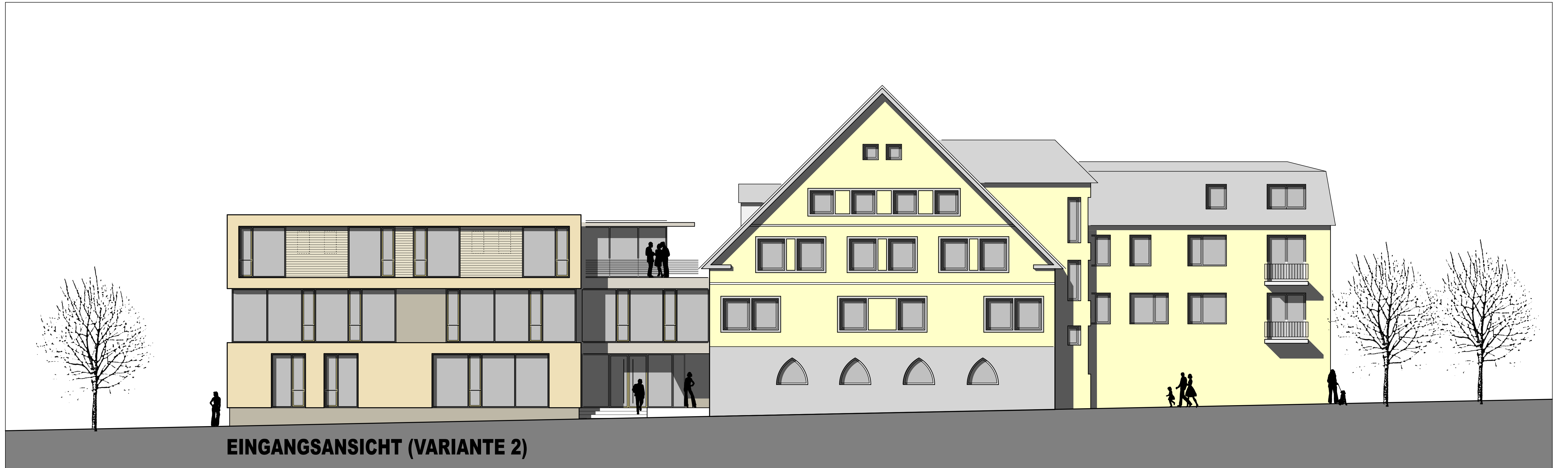
EINGANGSANSICHT (VARIANTE 2)